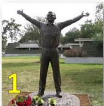
1 Н) Хьюстон, США