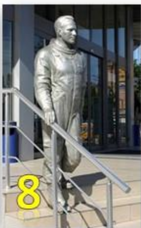
Е) Харьков, Украина