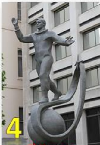
4 Л) Ижевск