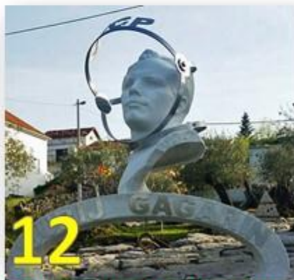
И) Радовичи, Черногория