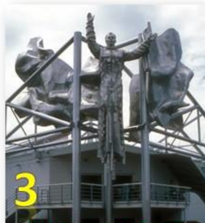
3 Б) Ванкувер, Канада