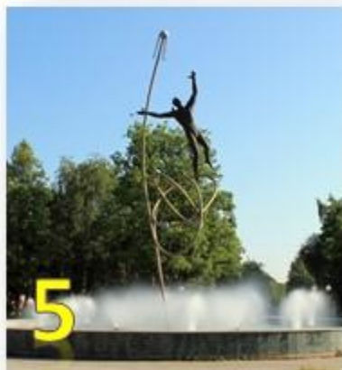
5 К) Йошкар-Ола