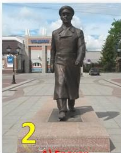
2 А) Брянск