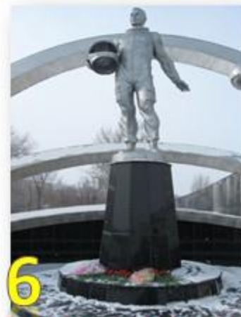
6 З) Караганда, Казахстан